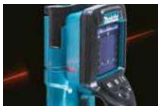
Laser de guidage (rouge)