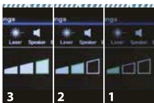
Écran pour réglage de la luminosité