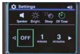
Minuterie*2 OFF / 1 / 3 / 5 / 10 minutes

*1 Règle le temps écoulé avant que le rétroéclairage de l'écran, le laser de guidage et la lumière s'éteignent lorsque le scanner est allumé et qu'aucune opération n'a lieu.