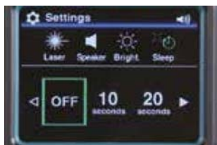
Veille*1 OFF / 10 / 20 / 30 / 60 / 120 / 240 secondes