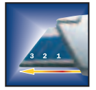
3-STUFIGER EINZIEHMECHANISMUS für verschiedene Schnitttiefen