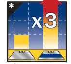
HÄLT 3MAL SO LANGE*