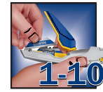
WERKZEUGFREIER ZUGRIFF AUF DIE KLINGE Magazin für 10 Klingen