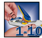
RETRAIT FACILE DE LA LAME, SANS OUTILS Stocke 10 lames