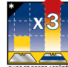
* DURE ET RESTE AFFÛTÉ 3X PLUS LONGTEMPS*