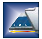
SORTIE DE LAME 3 POSITIONS permettant différentes profondeurs de coupe