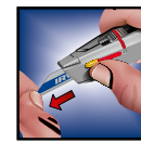
CHANGEMENT AÏSÉ DE LA LAME