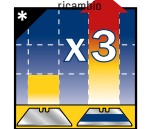
DURA 3 VOLTE DI PIÙ*