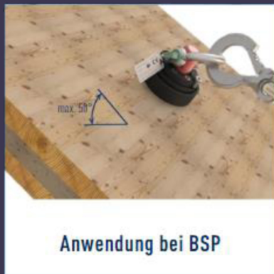
Anwendung bei BSP