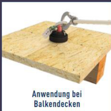
Anwendung bei Balkendecken