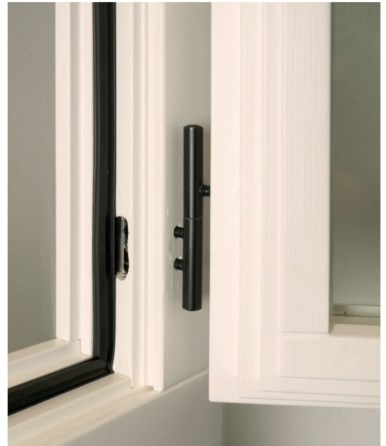
Fiche à percer werk14, type bombé acier verni noir