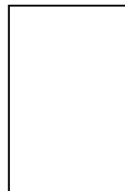
acier verni NCS / RAL autres finitions sur demande