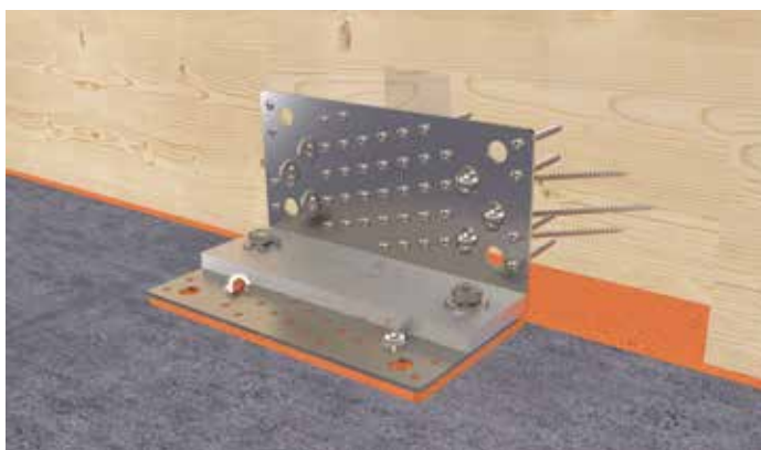
Scherwinkel zur Befestigung einer Wand am Betonfundament.