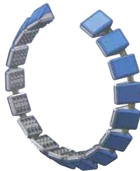
Les griffes en acier assurent une résistance durable.