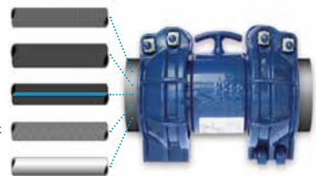
Possibilités d'application multiples.