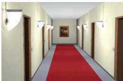
Installation en série d'appiques