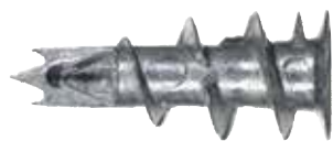
Fixation métallique pour carton-plâtre GKM