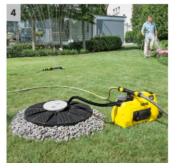
4 Aspiration optimale