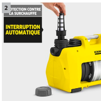
2 Sûr et longue durée de vie