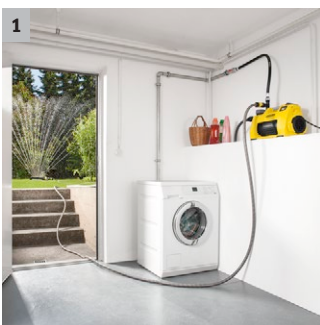
1 Facilement utilisable pour la maison et le jardin