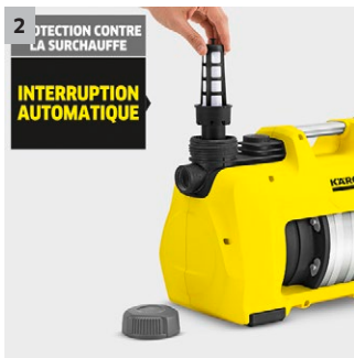
2 PROTECTION CONTRE LA SURCHAUFFE INTERRUPTION AUTOMATIQUE