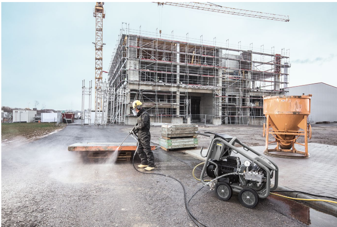
Combinaison de protection pour le nettoyage à haute et très haute pression taille L