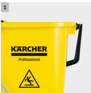
1 Ergonomischer Bügelgriff

Eimer mit 15 l Volumen, Trennwand, per Fußpedal bedienbarer Mopppresse und Bügelgriff.