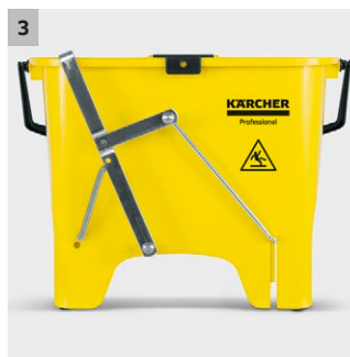
3 Léger et robuste