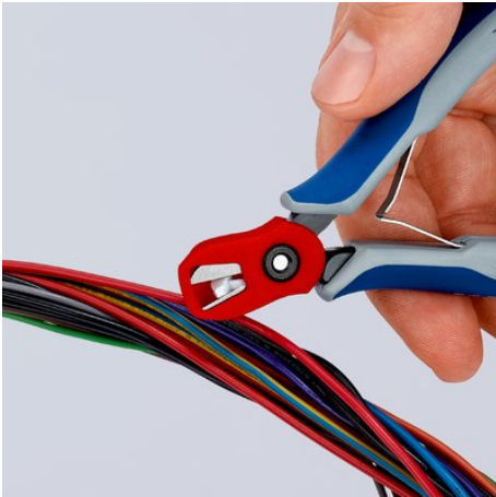
...il pezzo separato rimane al sicuro nel raccoglitore di materiale