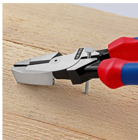
Zona di presa sotto lo snodo per azioni di leva e pressione