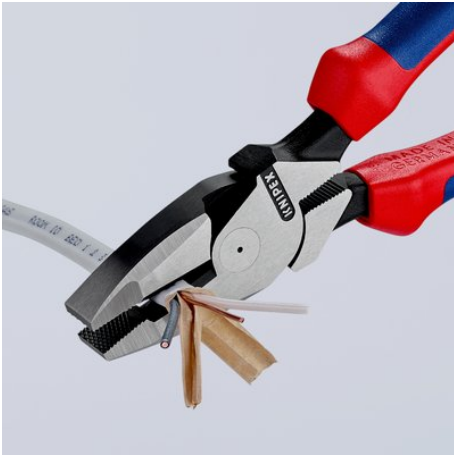
taglienti allungati per il taglio di cavi piatti