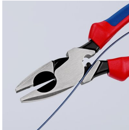
09 11/12 240: con tiracavo nell'articolazione