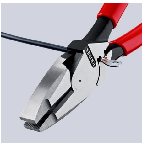
09 11/12 240: Universelle Dorn-Crimpstelle unterhalb des Gelenks

Technische Änderungen und Irrtümer vorbehalten