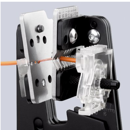
Dénudage suivant la forme du câble grâce aux profils coupants de précision

Kapton® est une marque déposée de E. I. du Pont de Nemours and Company Radox® est une marque déposée de Huber & Suhner AG