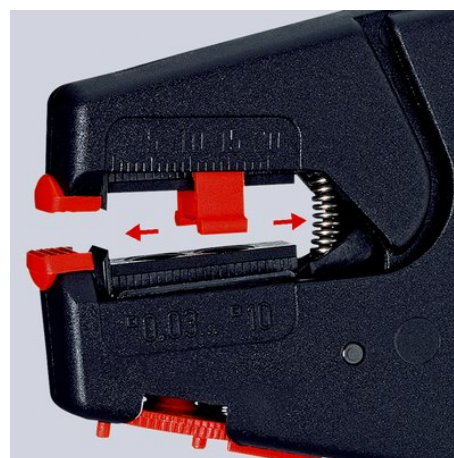
12 40 200: Arresto per regolazione della lunghezza