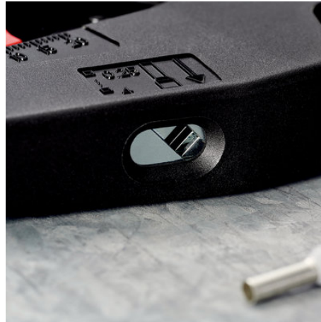
!Die Zwangssperre stellt beim Crimpen immer den perfekten Anpressdruck sich!