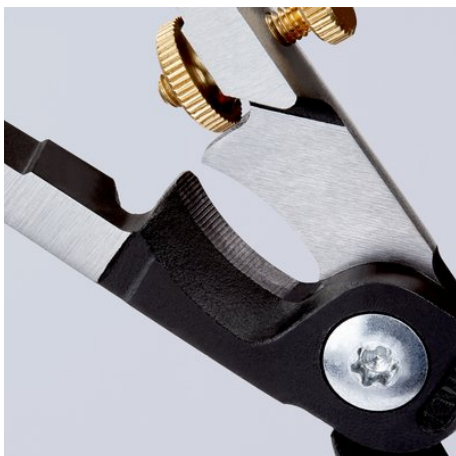
Tagliente di precisione temperato a induzione

Con riserva di modifiche tecniche e salvo errori