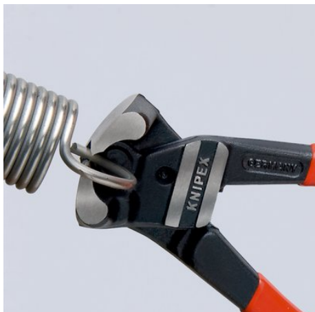
Elevata capacità di taglio: anche per filo armonico