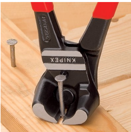
Nahezu bündiges Trennen von Bolzen, Nägeln usw.

Technische Änderungen und Irrtümer vorbehalten