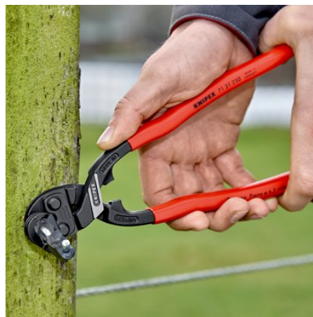
impiego con due mani per una forza di taglio massima