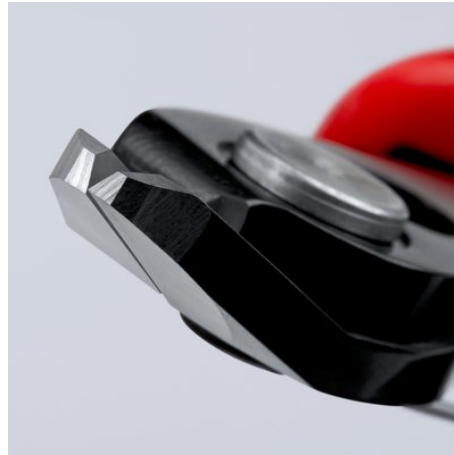
Scherschnitt mit kontrolliertem Micro-Schneidkantenversatz für lange Lebensdauer und ultrapräzisen Schnitt auch dünner Drähte