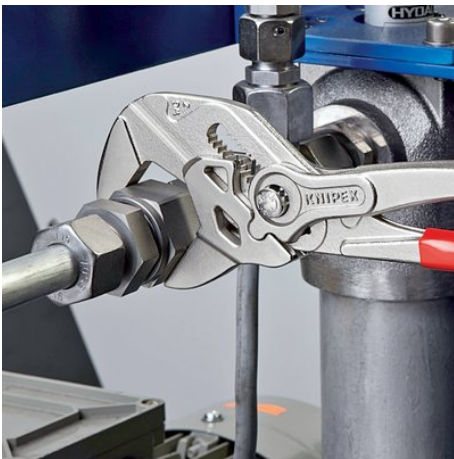
sostituisce un intero assortimento di chiavi metriche e in pollici