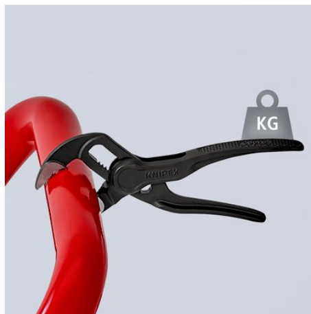
Autoserrante e resistente: una vera pinza regolabile per tubi e dadi KNIPEX