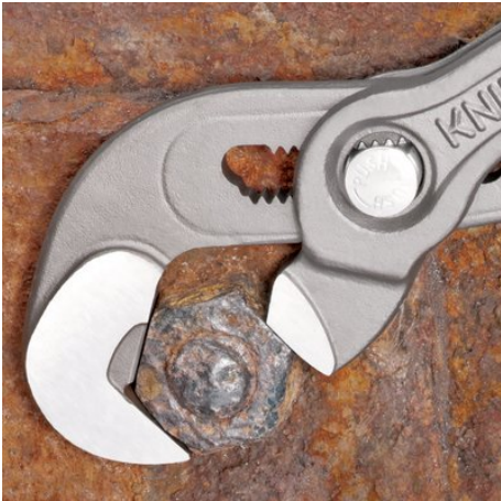
Lavoro su dadi arrugginiti con spigoli arrotondati