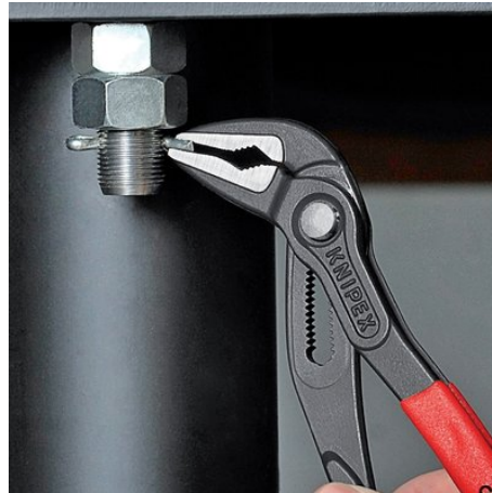
Sehr schlanke Bauform im gesamten Kopf- und Gelenkbereich (im Vergleich zu konventionellen Wasserpumpenzangen)