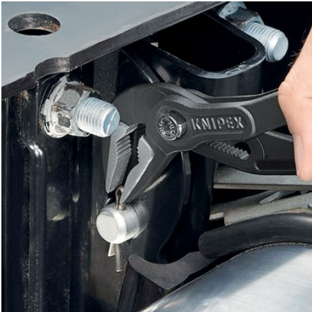
Optimaler Zugang zum Werkstück. Ideal für Service und Instandhaltung, Gerätereparatur, Fahrzeugbereich und Industrie