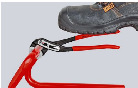
Autoserrante per tubi e dadi: nessuno scivolamento sul pezzo; l'intera capacità di azionamento può essere applicata per ruotare i pezzi; non è necessario premere con forza i manici della pinza, quindi minore sforzo