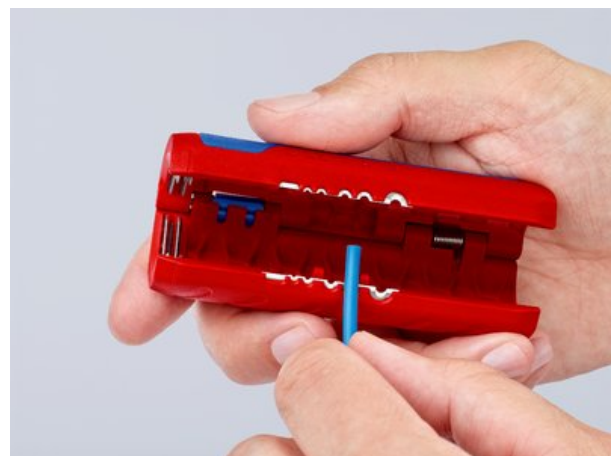
90 22 02 SB: Scala di lunghezza stampata a iniezione per una spelatura uniforme alla stessa lunghezza, leggibile per destrimano e mancini