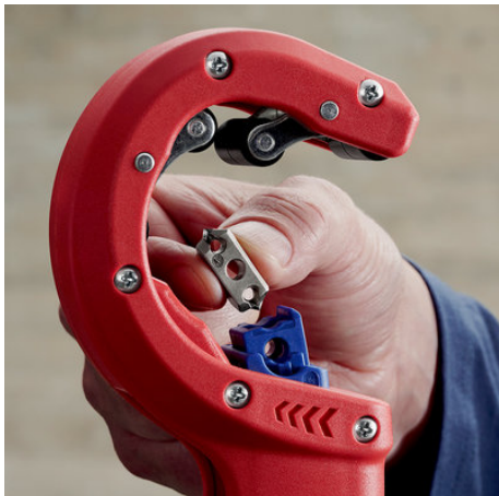
!Wenn die Klinge abgenutzt ist, kann sie ohne Werkzeug gewendet oder ausgetauscht werden!