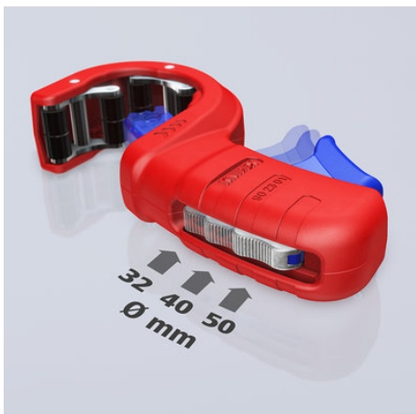
!Drei Durchmesser mit einem Werkzeug: Der Rohrdurchmesser lässt sich mit dem Metallversteller vor einstellen!