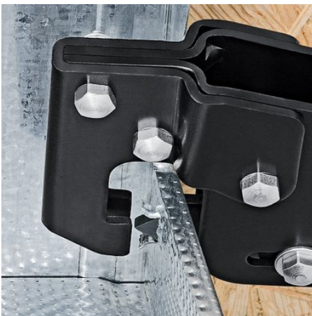
Il punzone viene premuto attraverso i profili in lamiera

Con riserva di modifiche tecniche e salvo errori