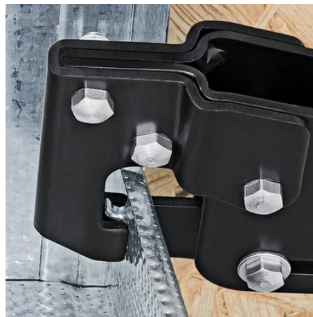
Posizionamento della punzonatrice su due profili di lamiera da unire