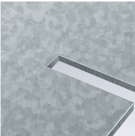
Ausklinken und Spanbrechen in einem Arbeitsgang

Technische Änderungen und Irrtümer vorbehalten