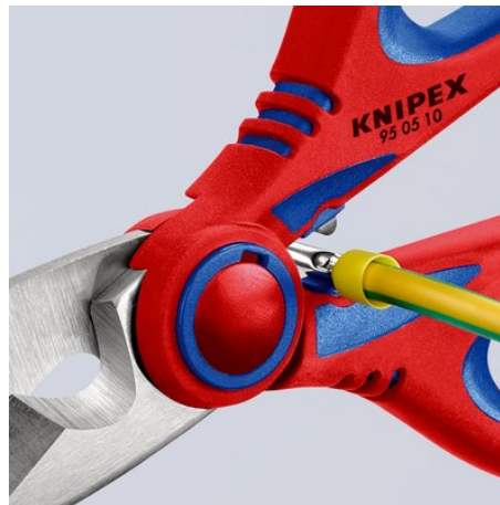
95 05 10 SB: Crimpatura rapida e semplice