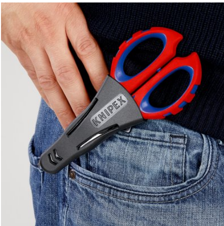
!Sicher verstaut und immer griffbereit!

Con riserva di modifiche tecniche e salvo errori