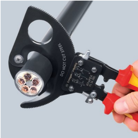
Ratschenprinzip und Zweigang-Zahnkranztrieb für kraftsparendes Schneiden