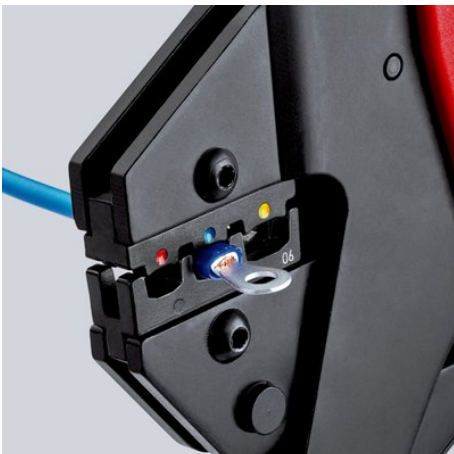
97 43 200 con matrice di crimpaggio 97 49 06 per terminali e connettori preisolati