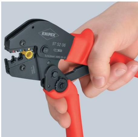
Erster Schritt: Heranholen des Schenkels mit zwei Fingern, bis beide Backen auf dem zu vercrimpenden Verbinder aufliegen