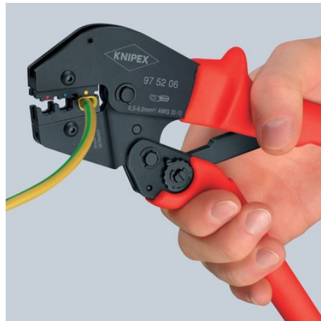
Dritter Schritt: Bei größerem Kraftbedarf z. B. bei isolierten Verbindern 6,00 mm 2 ist auf Grund der längeren Griffe eine Zweihandbedienung möglich Zweiter Schritt: Jetzt die ganze Hand für den weiteren Crimpvorgang benutzen