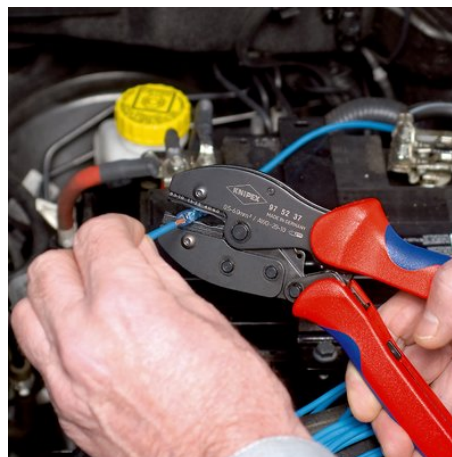
97 52 37