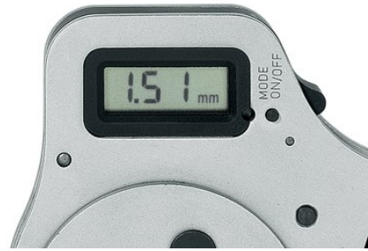
Multifunktionelle Digitalanzeige, Einstellung in mm, inch oder vergleichbare Selectorposition nach MIL