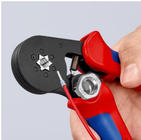
!Geeignet für feine Leiter: Crimpen von feinen Leitern ab 0,08 mm!