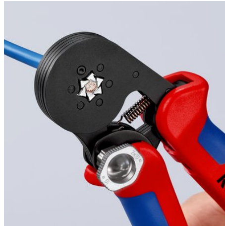
!Enorme Kapazität: Crimpen von Einzeladern bis zu 16 mm 2 oder Doppeladern bis zu 2 x 10 mm 2 !