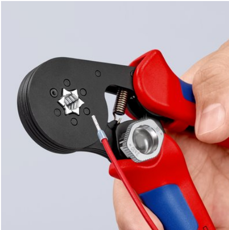
!Geeignet für feine Leiter: Crimpen von feinen Leitern ab 0,08 mm!