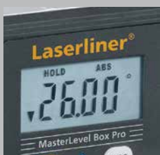
Écran d'affichage éclairé