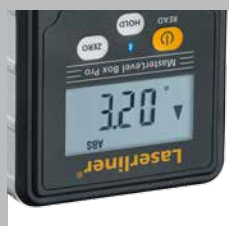
Écran d'affichage pivotant