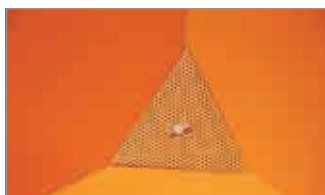
Siebblech (bei Späne-Ausführung)