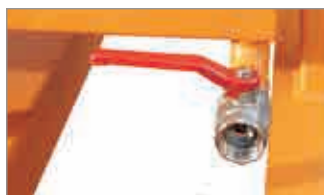
Ablasshahn 1" (bei Späne-Ausführung)