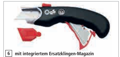
6 mit integriertem Ersatzklingen-Magazin