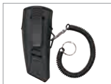
Gürteltasche für [1] und [8]