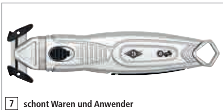
7 schont Waren und Anwender