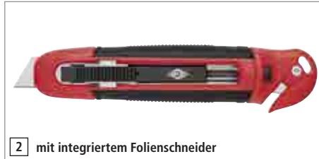
2 mit integriertem Folienschneider