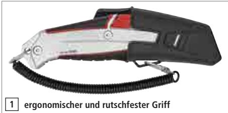
1 ergonomischer und rutschfester Griff