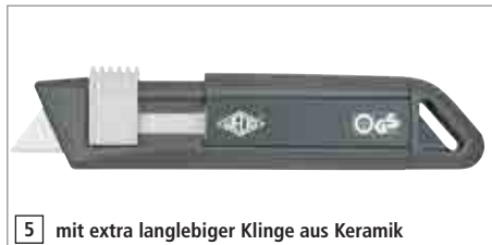
5 mit extra langlebiger Klinge aus Keramik