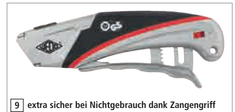
9 extra sicher bei Nichtgebrauch dank Zangengriff