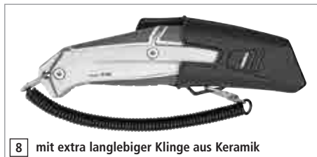
8 mit extra langlebiger Klinge aus Keramik