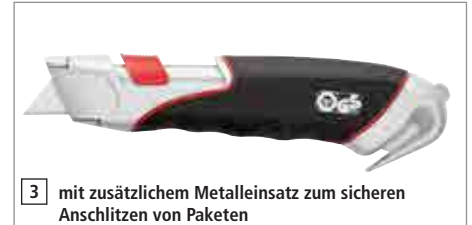
3 mit zusätzlichem Metalleinsatz zum sicheren Anschlitzen von Paketen