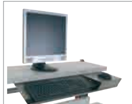
[13] Tastatur- und Mausablage fest