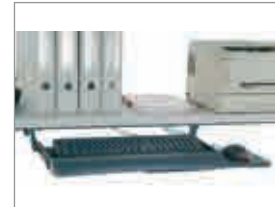
[14] Tastatur- und Mausablage ausziehbar