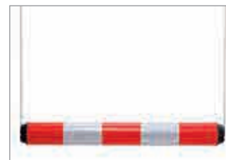
1 Ø 100 mm