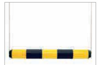
2 Höhe x Tiefe 150 x 20 mm