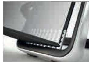
Außenrahmen aus gebürstetem Aluminium, Innenrahmen ABS-Kunststoff