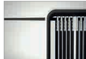
Sichttafeln mit stabilen Stahl-Drehzapfen